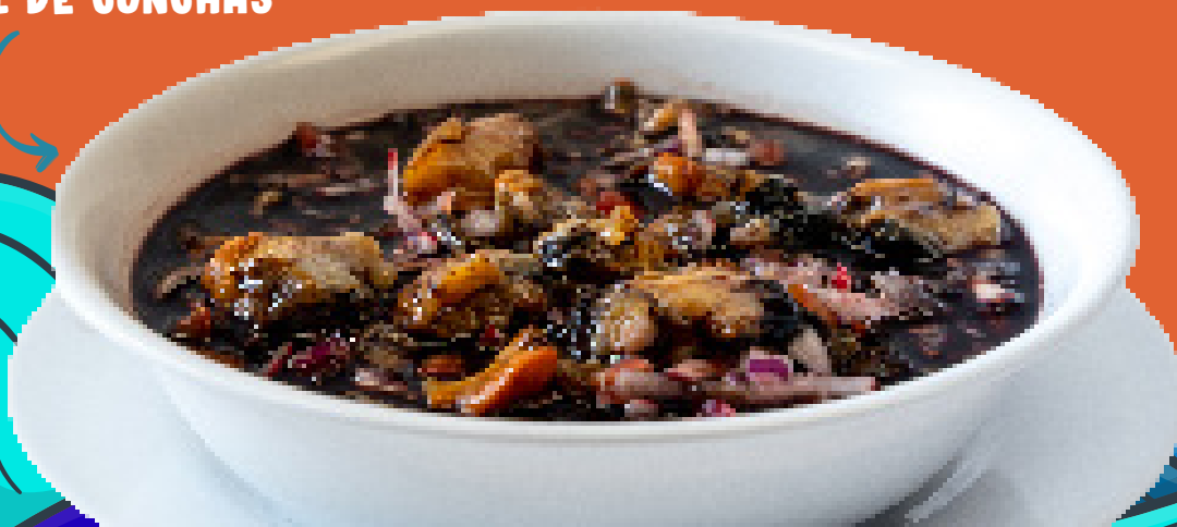
COCTEL DE CONCHAS